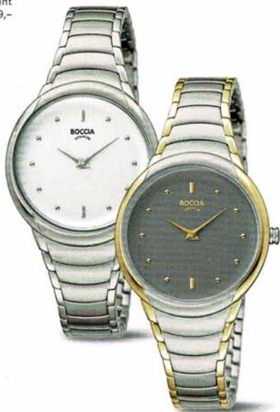
Bela 3276-12 | Bela 3276-13 € 129,- | € 149,-