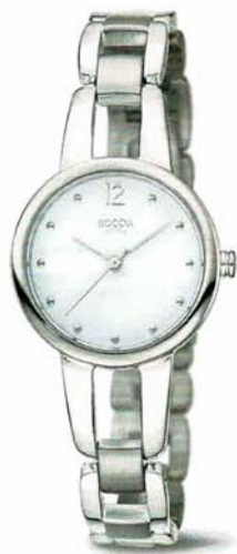
Bela 3290-01 € 98,-