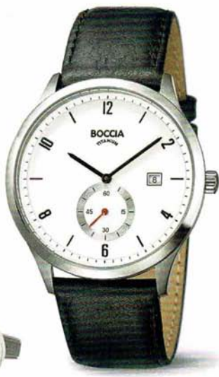
Lindo 3606-01 € 119,-

Bukur 3753-04 Titan, Datum, 5 bar, Lederband /// Askim 3615-05 Titan, Datum, 5 bar, Milanaise-Edelstahlband /// Askim 3615-03 Titan, Datum, 5 bar, Lederband /// Bukur 3750-04 Titan, Datum, 5 bar, Titanband /// Bukur 3614-03 Titan, Datum, 5 bar, Titanband /// Manschettenknöpfe 0604-03 Titan /// Lindo 3606-01 Titan, kleine Sekunde, Datum, 5 bar, Lederband /// Alle Preise sind unverbindliche Preisempfehlungen.