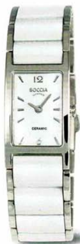
Ceramic | 3201-01 € 139,-