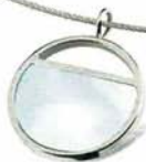
07024-01 | Anhänger | Perlmutter € 59,- 0802-01 | Collier € 29,-