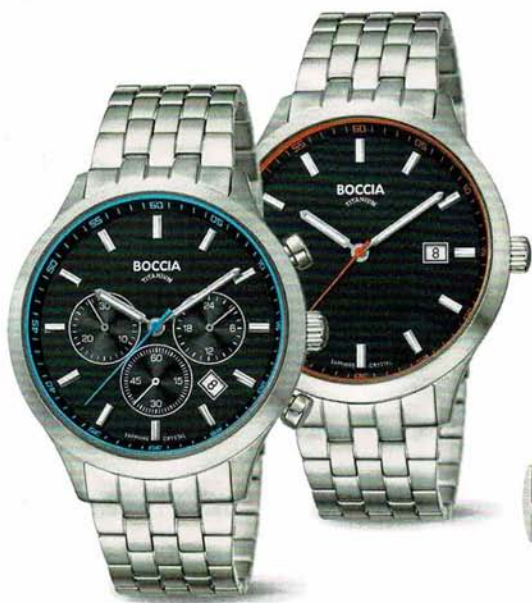
Bukur 3750-04 | Chronograph | Saphirglas Bukur 3614-03 | Saphirglas € 179,- | € 149,-