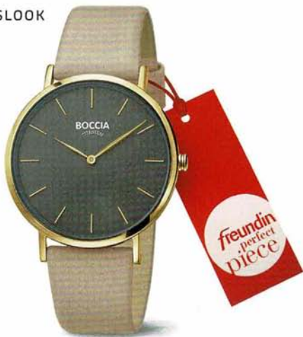
Lindo 3273-04 | Gewinner des freundin perfect piece-Award 2018 € 98,-

Askim 3283-02 Titan, goldplattiert, 5 bar, Milanaise-Edelstahlband /// Askim 3283-01 Titan, 5 bar, Milanaise-Edelstahlband /// Askim 3283-03 Titan, roségoldplattiert, 5 bar, Milanaise-Edelstahlband /// Anhänger 07024-01 Titan /// Collier 0802-01 Edelstahl /// Ohrstecker 05034-01 Titan /// Creolen 0592-02 Titan, tricolor /// Qela 3290-01 Titan, Perlmutterzifferblatt, 5 bar, Titanband /// Ceramic 3201-01 Titan, 5 bar, Titan/Ceramicband /// Ring 0134-06 Titan, teil-goldplattiert /// Ring 0144-01 Titan, teil-goldplattiert /// Ring 0129-07 Titan, teil-roségoldplattiert /// Ring 0135-03 Titan, tricolor /// Ring 0138-04 Titan, teil-goldplattiert /// Lindo 3273-04 Titan, goldplattiert, 3 bar, Lederband /// Alle Preise sind unverbindliche Preisempfehlungen.