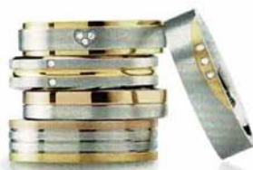
0134-06 | Ring mit 3 Brillanten 0,015 ct 0144-01 | Ring mit 2 Brillanten 0,01 ct 0129-07 | Ring | 0135-03 | Ring 0138-04 | Ring mit 3 Brillanten 0,015 ct