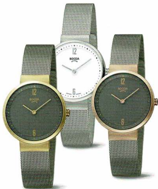
Askim 3283-02 | Saphirglas | Askim 3283-01 Saphirglas | Askim 3283-03 Saphirglas € 119,- | € 99,- | € 119,-