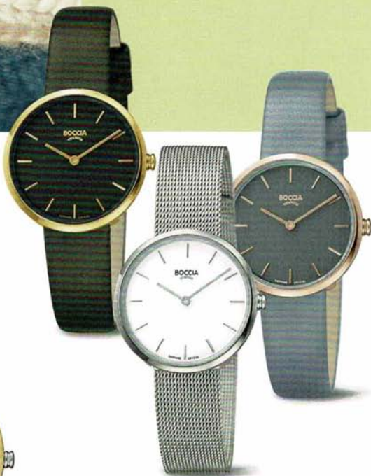
Beddu 3279-02 | Saphirglas | Beddu 3279-04 | Saphirglas Beddu 3279-03 Saphirglas € 109,- | € 109,- | € 109,-