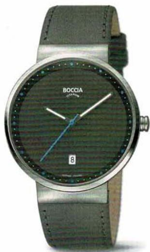
Askim 3615-03 | Saphirglas € 109,-