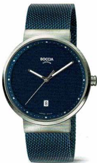
Askim 3615-05 | Saphirglas € 119,-