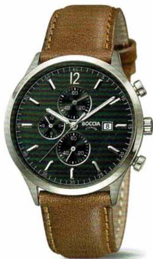
Bukur 3753-04 | Chronograph € 159,-