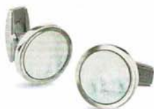
0604-03 | Manschettenknöpfe Perlmutter € 89,-